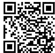
報名網址 QR CODE